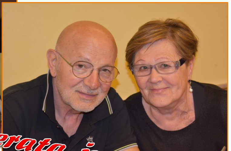
Una serata in allegria