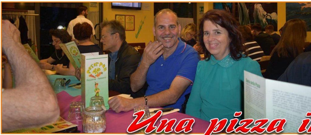
Una pizza insieme