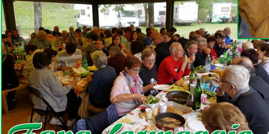
Fava formaggio vino e...