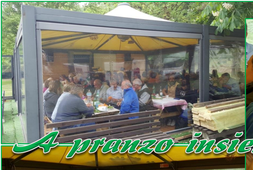
A pranzo insieme